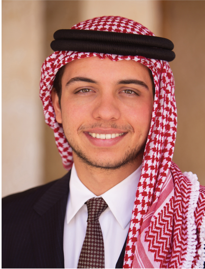
صاحب السمو الملكي ولي العهد الأمير حسين بن عبدالله الثاني المعظم حفظه الله ورعاه