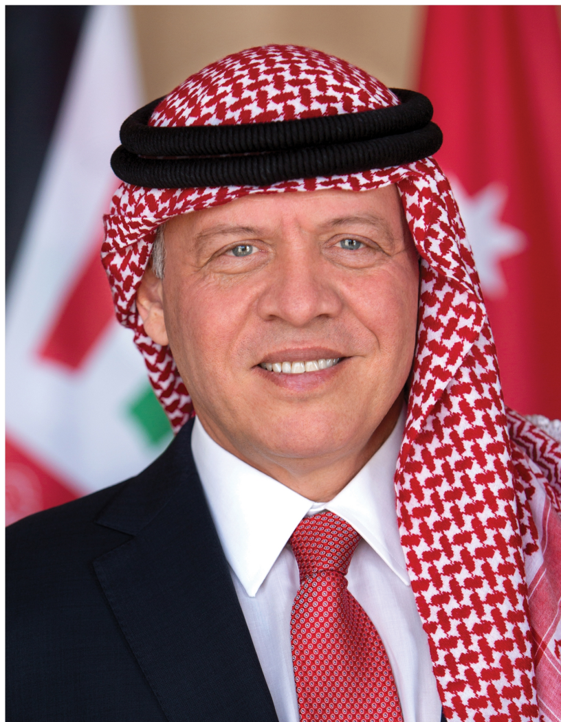
صاحب الجلالة الهاشمية الملك عبدالله الثاني بن الحسين المعظم حفظه الله ورعاه