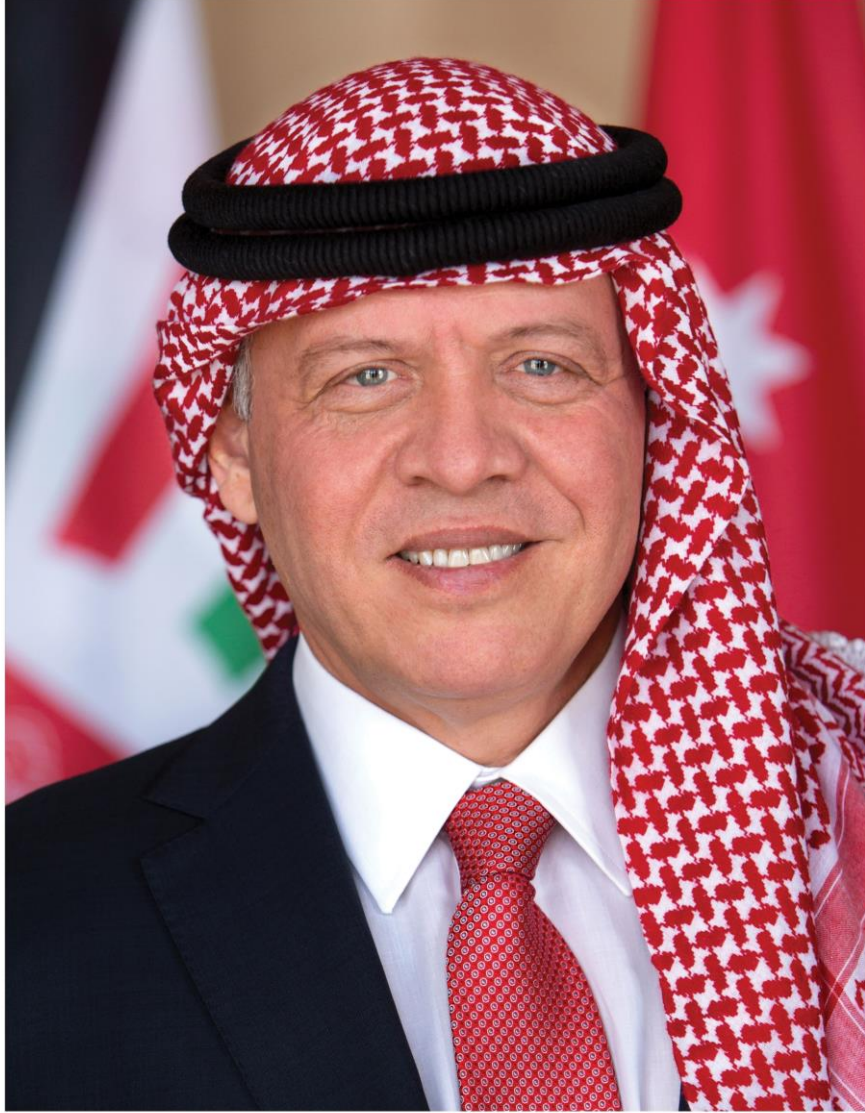
صاحب الجلالة الهاشمية الملك عبدالله الثاني بن الحسين المعظم حفظه الله ورعاه